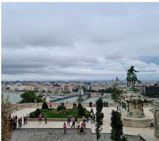
Aussicht vom Burgpalast auf das Eugen-von-Savoyen-Denkmal, die Kettenbrücke und den Stadtteil Pest