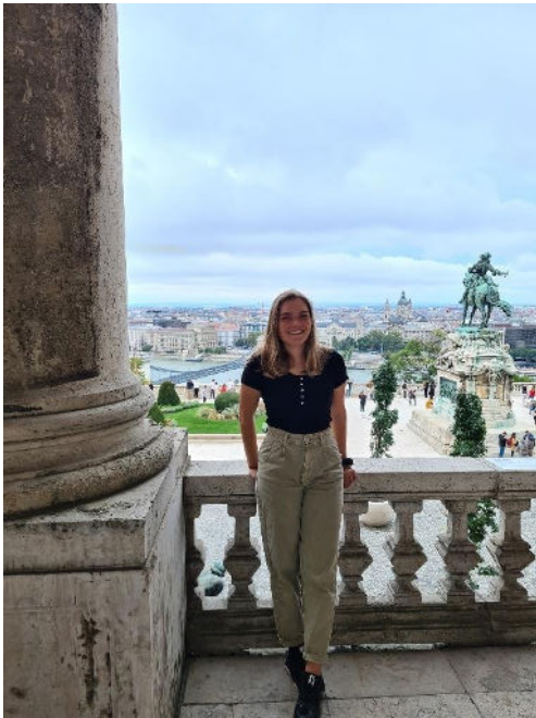
Aussicht vom Burgpalast auf das Eugen-von-Savoyen-Denkmal

Noch bevor ich überhaupt mein Studium aufnahm, stand für mich eines fest: Ich wollte die Welt sehen – und zwar nicht nur als Reisende, sondern mitten im Studium, mit all den Chancen, die damit verbunden sind. Für mich bedeutete das, über den fachlichen Tellerrand hinauszublicken, neue Kulturen kennenzulernen und gleichzeitig auch persönlich zu wachsen. Das ERASMUS-Programm bot dafür die perfekte Möglichkeit. An der MedUni Wien steht es im 5. Studienjahr offen, und für mich war schnell klar: Diese Chance wollte ich unbedingt nutzen.