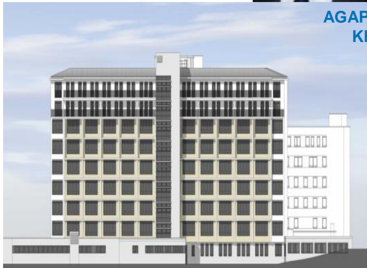
AGAPLESION MARKUS KRANKENHAUS (650 Betten)