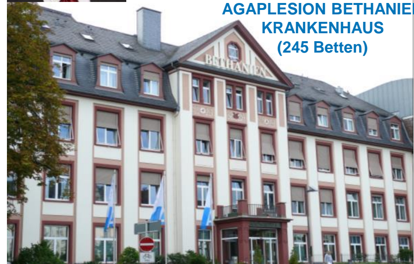
AGAPLESION BETHANIEN KRANKENHAUS (245 Betten)