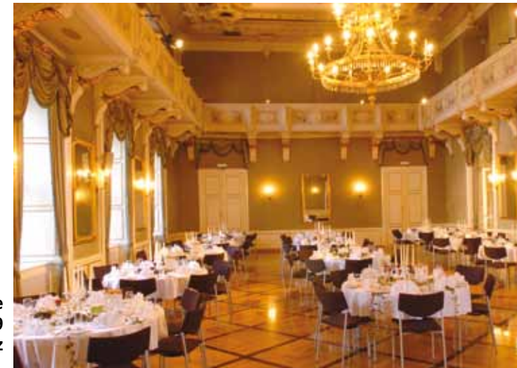
Redoutensäle Promenade 39 4020 Linz